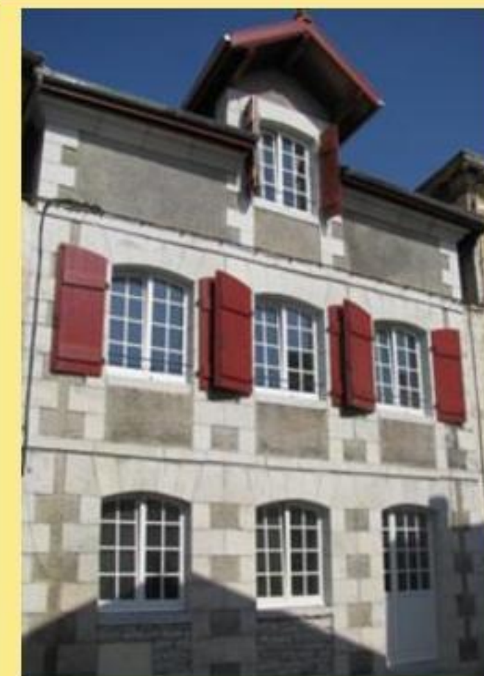
Exemple de maison rénovée respectant l'esprit de l'AVAP et du patrimoine bidachot

Des points particuliers sont définis pour chacun des 4 secteurs. En dehors de ces secteurs, il existe une charte de protection des paysages. Ces documents sont disponibles www.bidache.fr (Village/Info/Mairie).