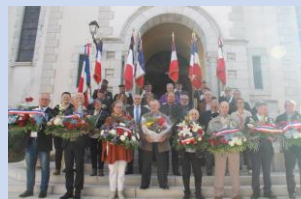
Cérémonie du 11/11/2025

La rétrocession des concessions abandonnées au cimetière est en cours d'achèvement : le constat est prévu le 05/01/2026 à 15h . Plusieurs demandes ont été enregistrées, parfois pour un même caveau. Le mode d'attribution – tirage au sort ou ordre d'inscription – reste à préciser. Enfin, la commune clôturera le mois en musique avec un concert gratuit le 30 novembre à 17h à l'église , réunissant un quintette à cordes et une chanteuse lyrique.